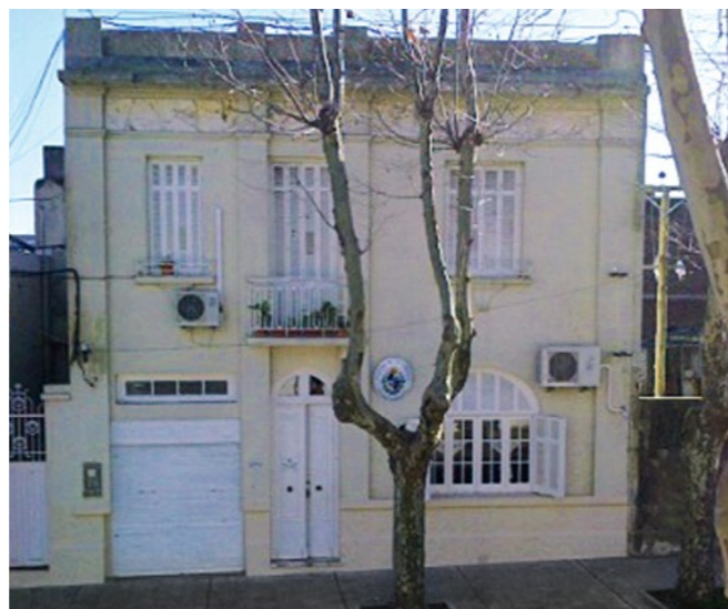
Nueva sede de la Fiscalía Letrada Departamental de Colonia

En las inspecciones que se llevan a cabo en el interior del país se ha instrumentado el contacto con el Colegio de Abogados, como también con los jueces letrados de las respectivas localidades para obtener una mirada externa del trabajo desempeñado por las fiscalías. 🌟