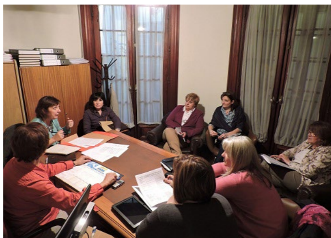
Miembros de la Comisión Institucional Documental en pleno trabajo

En una primera etapa se solicitó a todos los Fiscales a cargo de la Jefatura Administrativa de las distintas sedes del país la designación de un funcionario administrativo, como interlocutor referente de la Comisión, para proporcionar información sobre la situación de