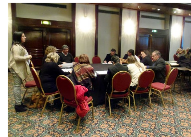
Uno de los grupos de trabajo en los talleres “Información y sensibilización sobre el consumo problemático de sustancias psicoactivas” en el Hotel Radisson Victoria Palace