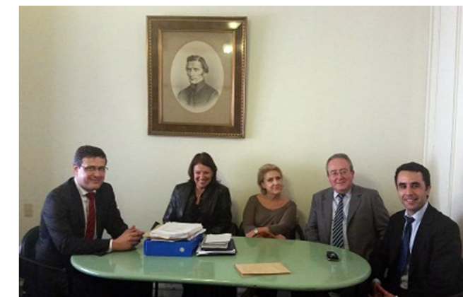
Miembros del Tribunal de Concurso de Fiscal Letrado Nacional, junto al Fiscal de Corte Dr. Jorge Díaz y Fiscal Adscripto, Dr. Ignacio Montedeocar

Se encuentra en sus últimas etapas el concurso llamado para proveer cargos de Fiscal Letrado Departamental. Se cumplió con la prueba escrita de oposición el 5 de julio y con la evaluación de los méritos, resta únicamente la corrección de la prueba psicolaboral realizada el día 27 de agosto pasado.