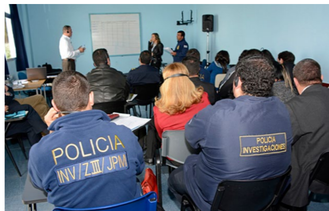
Foto tomada durante el Curso de Investigación Criminal Nivel I

El encuentro fue muy bien evaluado por los participantes que manifestaron su deseo de reiterar actividades de intercambio de este tipo, por lo que, seguramente se replique al menos en dos departamentos del interior de nuestro país.