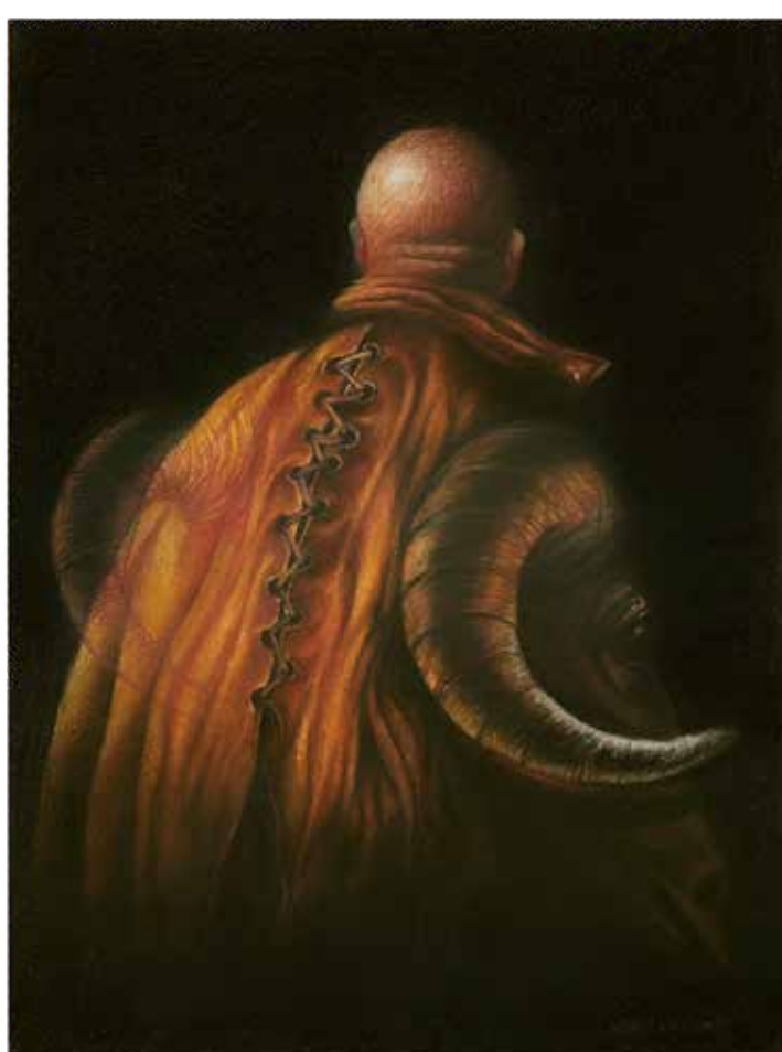
Sin título N.º 2 Pastel tiza s/papel 56 x 76 cm 2002 (IZQUIERDA)