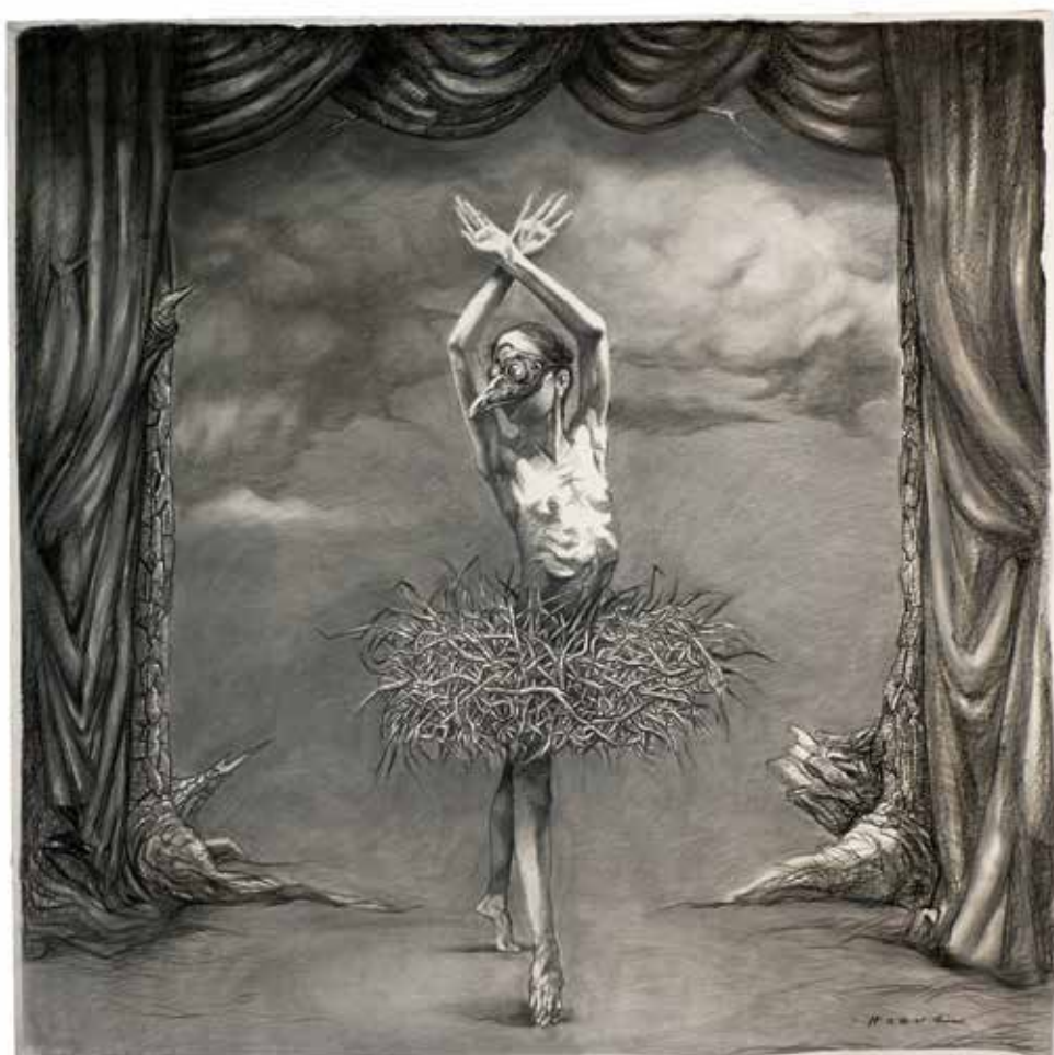
Sin título N.º 26 Carbonilla s/papel 150 x 152,5 cm 2021