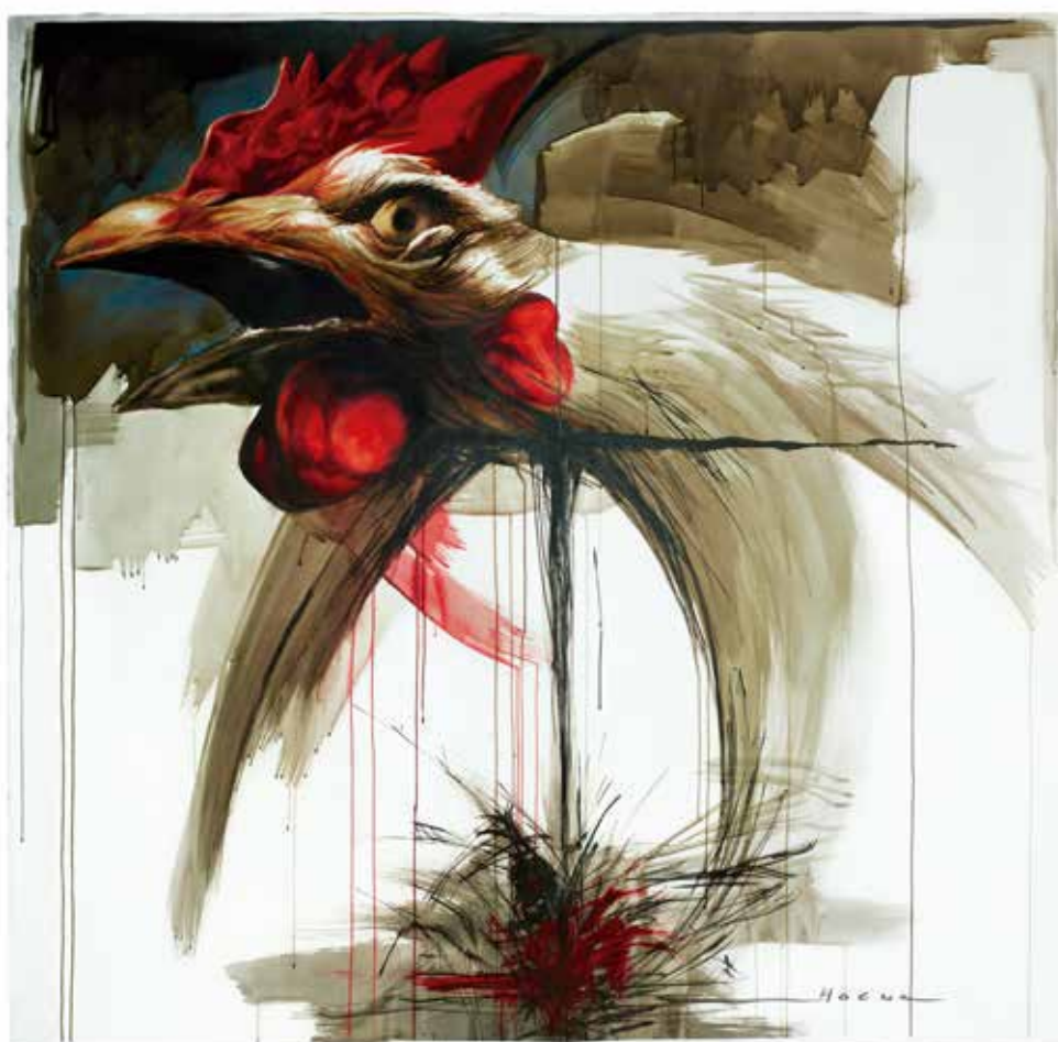
Sin título N.º 15 Técnica mixta s/papel 152,5 X 150 cm 2020

Sin título N.º 1 Pastel tiza s/papel 56 X 76 cm 2002